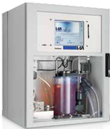
Hochempfindliche Bakterien in einem robusten Gerät.