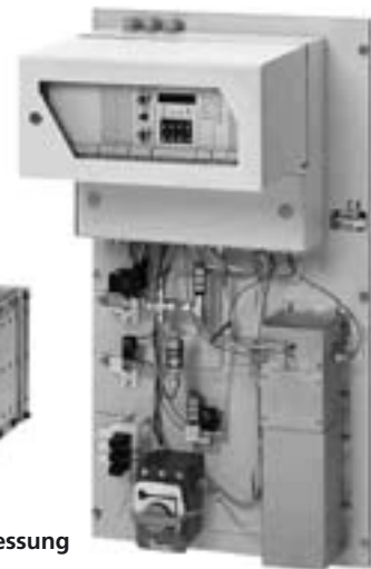
FID zur Wassermessung