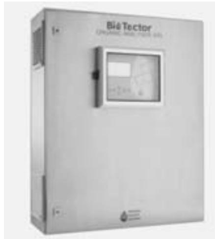
Biotector TOC Analysator

serfördersystem ist einfach und robust. Unsere Servicetechniker, mit jahrelanger TOC-Erfahrung, sind vom Gerät überzeugt. Die ersten Erfahrungen eines verkauften Gerätes erfüllen alle Versprechungen des Herstellers.