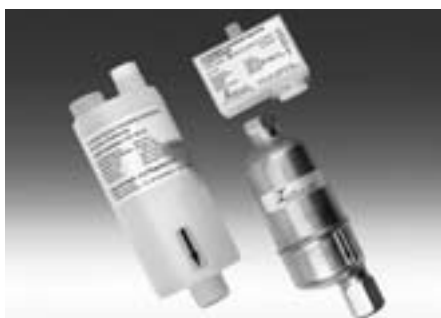
AK20 automatischer Kondensatabscheider

matischen Kondensatabscheider AK20 aus Teflon ist das Problem ein für alle Mal gelöst. Besitzt ihre Messung eine zu grosse Umgebungsdruckabhängigkeit? Der Rückdruckregler von Bühler Technologies löst das Problem.