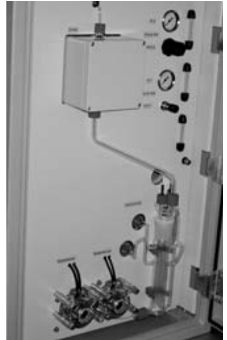
TOC2100 UV-TOC Analysator