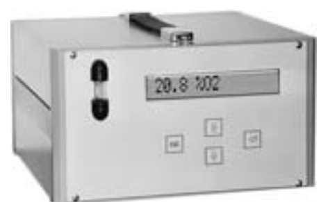
PAROX 2100 tragbares Sauerstoffmessgerät