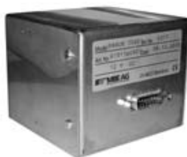
Paramagnetischer Sauerstoffsensor PAROX 1000

MBE AG hat vor 15 Jahren mit der Herstellung von paramagnetischen Sauerstoffmessgeräten begonnen und später den paramagnetischen Sauerstoffsensor PAROX 1000 entwickelt. Die Sauerstoffsensoren PAROX 1000 und Sauerstoffmessgeräte PAROX 2000 werden in den verschiedensten Bauformen an weltweit führende Hersteller von Gasanalysatoren geliefert.